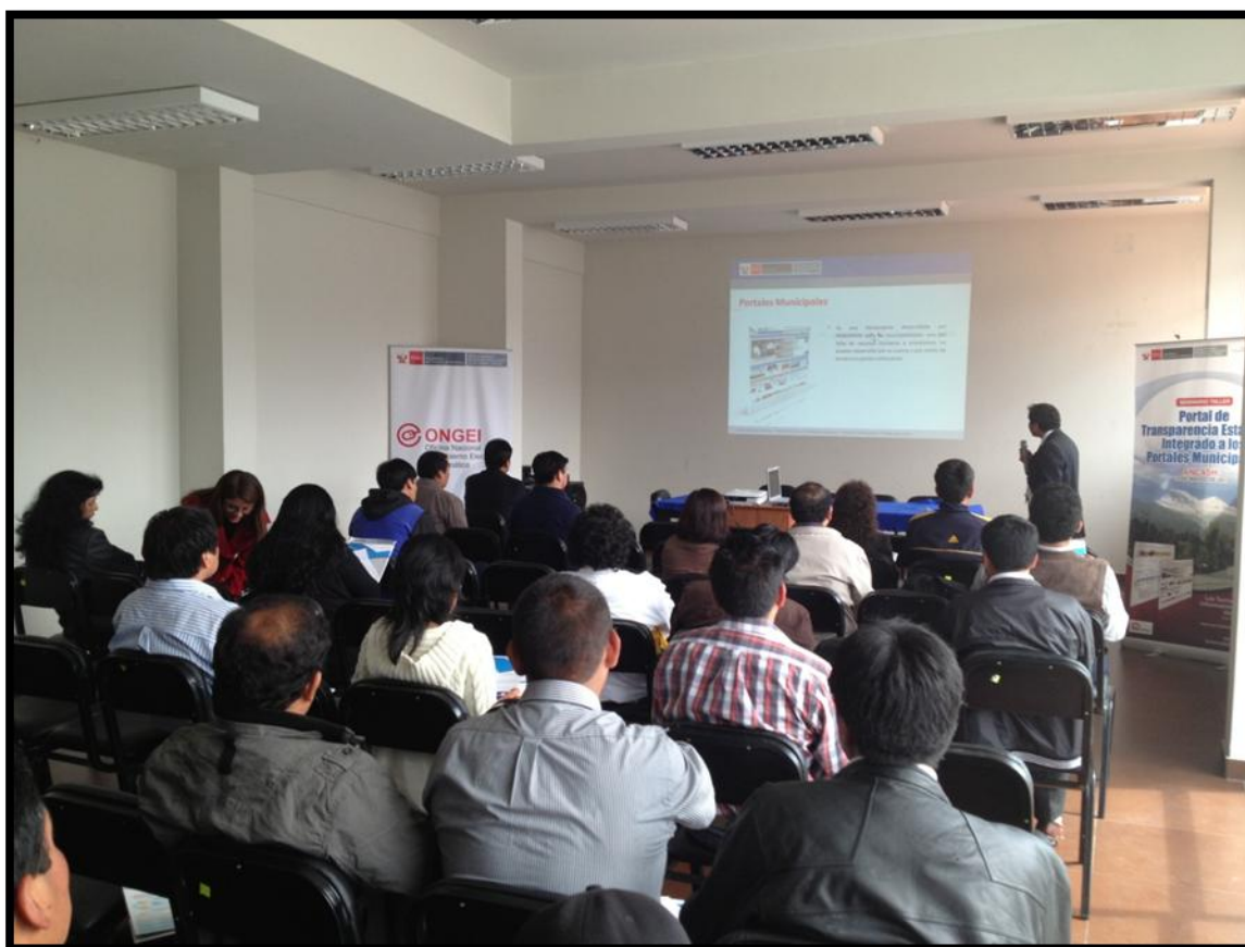
Evento realizado en Huaraz, reunió a más de ochenta funcionarios públicos.

En el seminario, se expusieron los ítems para una óptima administración del Portal de Transparencia Estándar, en sus diversos módulos, como planeamiento y organización, información de personal, información de contrataciones, información presupuestal, proyectos de inversión, actividades oficiales y participación ciudadana.