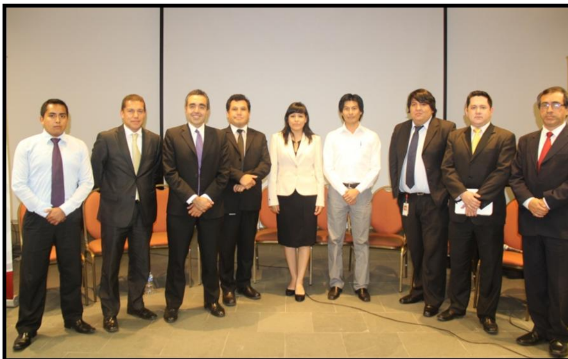
Al final se acordó que MICROSOFT y APESOL cooperarán en estandarizar webs del Estado.

A lo largo del encuentro, donde asistieron más de 200 participantes, se desarrollaron también tres sesiones de debate relacionadas a “Infraestructura”, “Desarrollo” y “Estándares y Gestión de proyectos”, donde los presentes pudieron expresar sus inquietudes y hacer sus propuestas a fin de enriquecer los temas expuestos durante el evento.